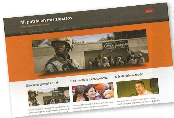
Los diseños y contenidos de los blogs varían según sus autores.

que, incluso, solicitar más ancho de banda a mi 'hosting'. Es un espacio en el que esta bloguera, madre de dos niños pequeños y residente en Vitoria, escribe "sobre lo que me apetece en cada momento". De esta manera comparte su punto de vista sobre asuntos tan variopintos como frases infantiles ingeniosas o la subida del IVA.