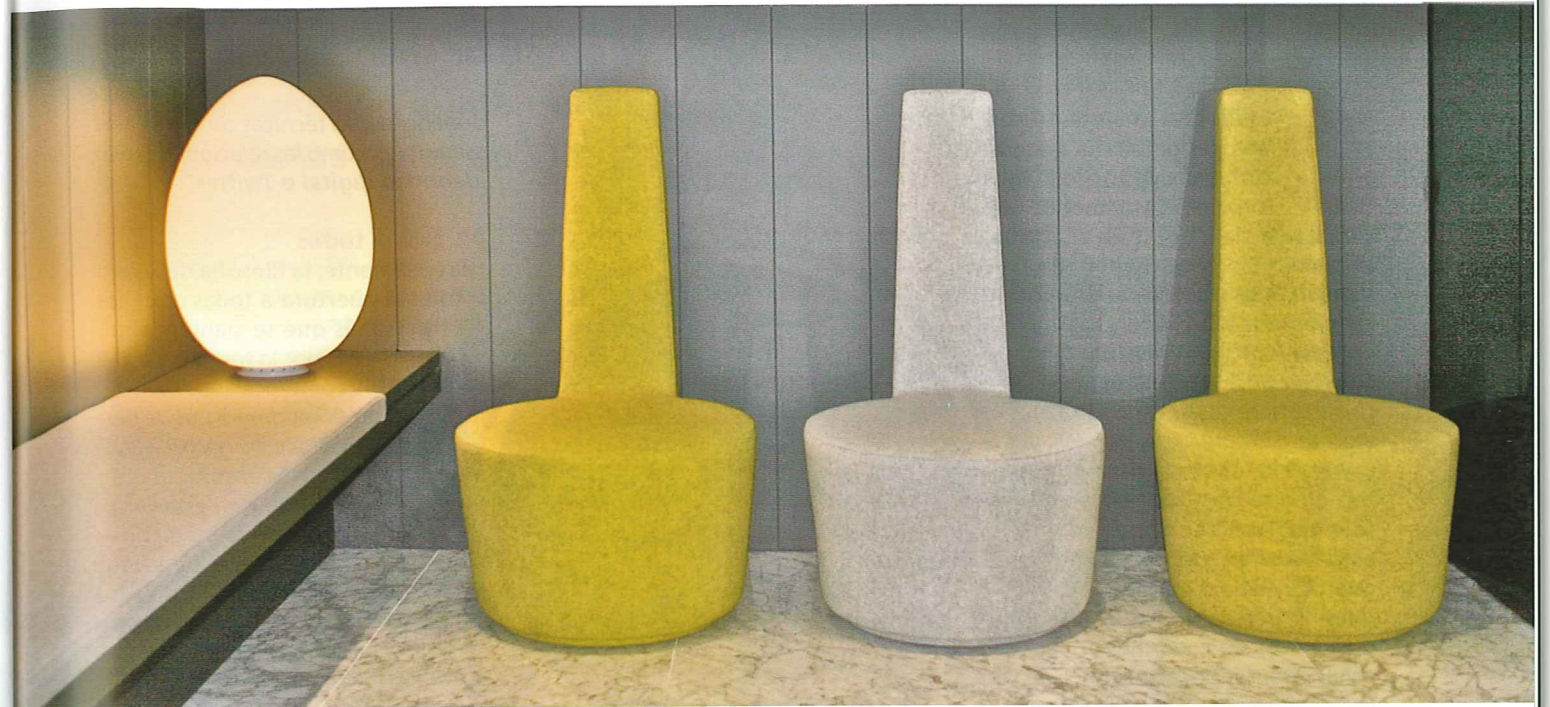
Sala de espera de la clínica GDENT en C/Lascaray 2, bajo. Diseñada por Francesc Rifé.